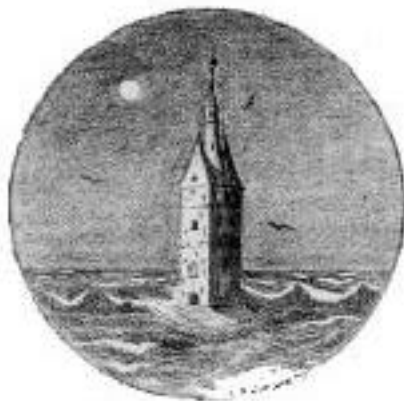
Der alte Kirchturm auf Wangerooq.