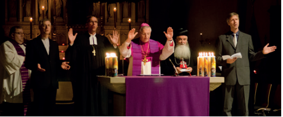
Farklı kiliselerden episkoposlar ve pastörlerle ekümenik bir ayin

Almanya'da bu protestan, katolik ve ortodoks kiliselerin yanında diğer bağımsız kiliseler de vardır. Onlardan bir çoğu bağımsız kilise olarak anılır (bkz. Sayfa 36-37). Ortodoks geleneğindeki hristiyanlık kilise binaları protestan veya katolik kilise binalarından biraz daha farklı görünürler. Farklı bağımsız kiliselerin ibadet mekanları da farklı şekillerde düzenlenmiştir.