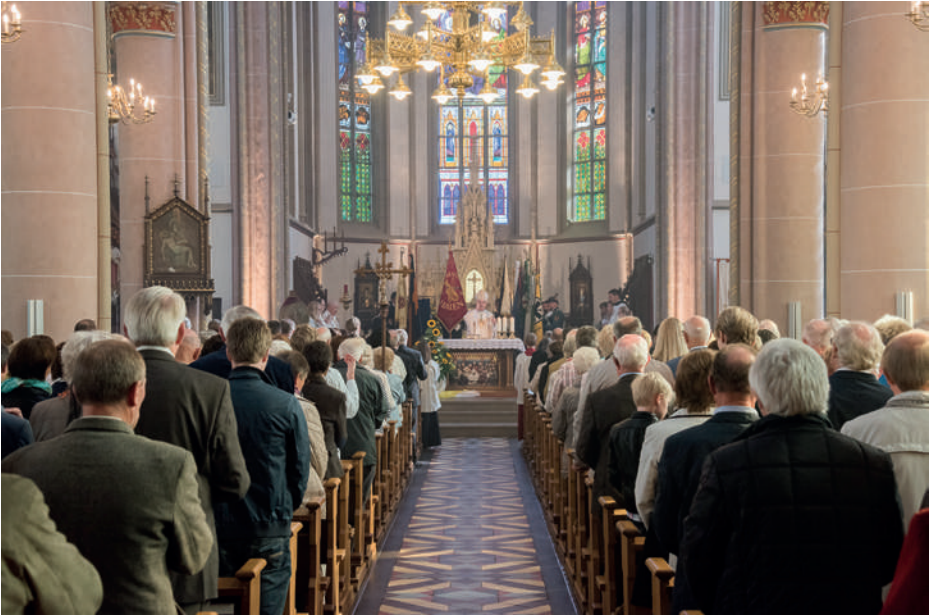
Camilerde mihrap Mekke'ye yöneliktir.