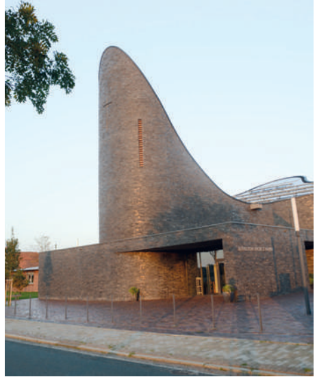
Kilise binaları dışarıdan bu kadar farklı görünebilirler.