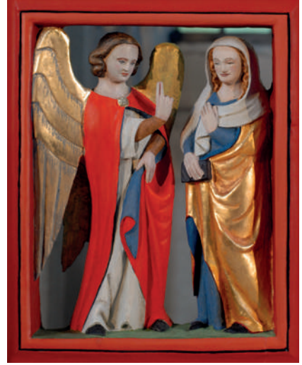
Melek Gabriel Meryem'e Tanrı'nın kudretiyle Oğlu İsa'ya hamile kalacağını müjdeliyor.

Bir çok kilisede meleklerin tasvirleri görülür. Kutsal Kitap'ta melekler Tanrı ile insanlar arasında haberciler olarak görülür. Melekler halkın dindarlığında büyük bir rol oynarlar.