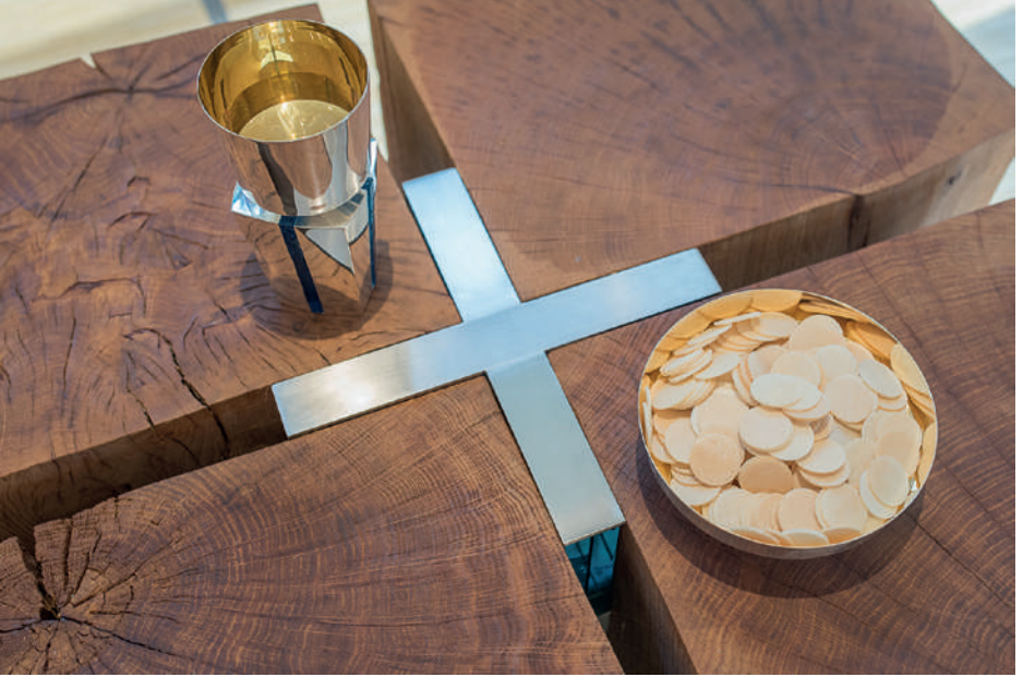
Şarap dolu kadeh ve (yuvarlak "Hostiyeler" şeklinde) ekmek

onlara, bu Son Akşam Yemeği'ni anarak ekmeği ve şarabı aldıklarında kendisinin şahsen bu ekmek ve şarapta mevcut olacağını vadedmiştir.