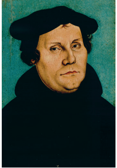
Reformcu Martin Luther

Bir diğer tipik protestan bayramı ise Tövbe ve Dua Günü'dür. Kasım ayının ikinci yarısında, kilise yılının son Pazar gününden önceki Çarşamba günü kutlanır. Tövbe ve Dua Günü imanlıları Tanrı'nın önündeki yaşamlarını gözden geçirmeye ve tövbeye çağırır.