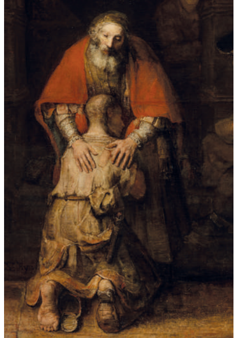
"Merhametli Baba" tablosu Tanrı'nın merhametinden bahsetmektedir.

Kutsal Kitap'taki konular hakkında resimleri özellikle İsa'nın yaşamıyla ilgili olanlar hem protestan hem de katolik kiliselerinde görülebilir. Ancak kiliselerdeki resimler ve sanatsal temsil konusunda farklı düşünce tarzları oluşmuştur.